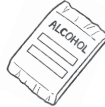
Alcohol Pad Alcool Pads